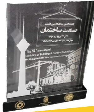
چهاردهمین نمایشگاه تخصصی صنعت ساختمان- ۱۳۹۳- تهران