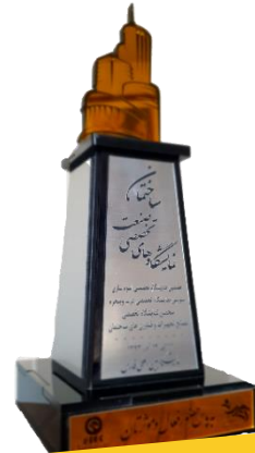
هفتمین نمایشگاه تخصصی صنعت ساختمان- ۱۳۹۳- فارس