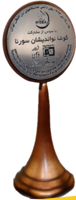
نمایشگاه بین‌المللی معماری و دکوراسیون داخلی (MIDEX)- تهران-۱۳۹۳