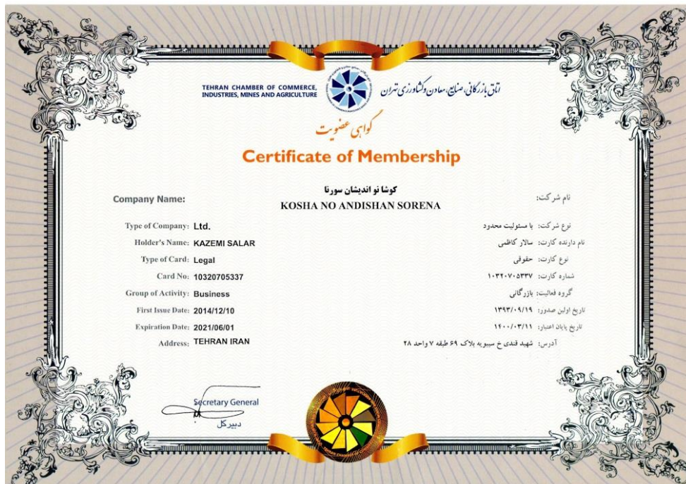
گواهی عضویت در اتاق بازرگانی صنایع، معادن و کشاورزی تهران